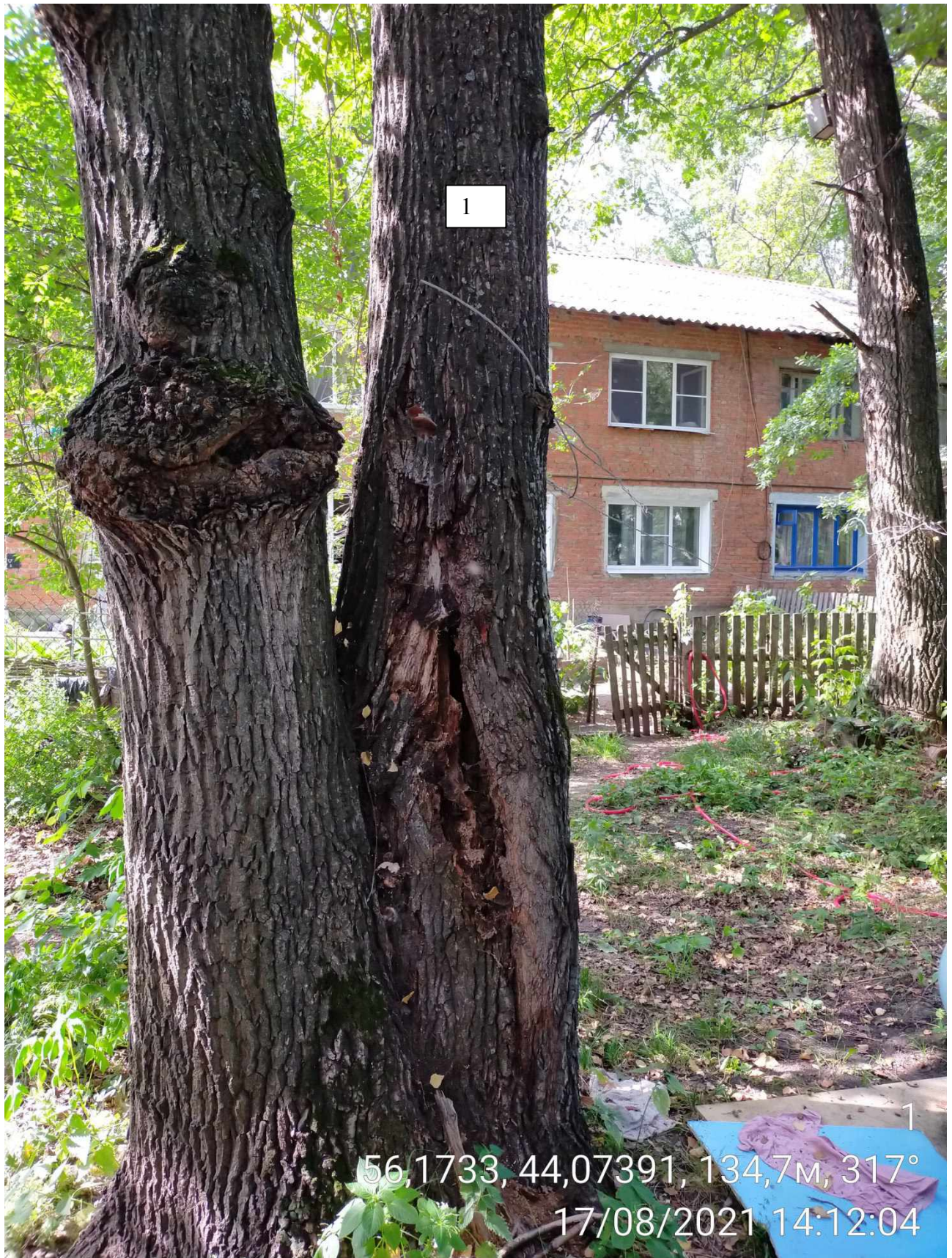
Дерево № 1